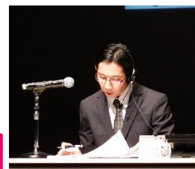
2015年 キューアンドエーグループオペレーターコンテストの様子